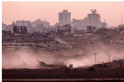
Un véhicule israélien revenant de Gaza au niveau de la frontière le 1er juillet 2025.

Je suis historien et je ne saurais lire aucune boule de cristal. Ce que je constate, c'est que la faillite totale des accords d'Oslo et le renforcement continu de la colonisation ont rendu obsolète la manière dont l'OLP [ Organisation de libération de la Palestine – ndlr ] et le Fatah pensaient pouvoir défendre les droits des Palestiniens. Mais le Hamas a été créé en 1987 et quelle est la situation aujourd'hui ? Gaza est presque totalement détruite et la situation en Cisjordanie est pire que ce qu'elle a jamais été.